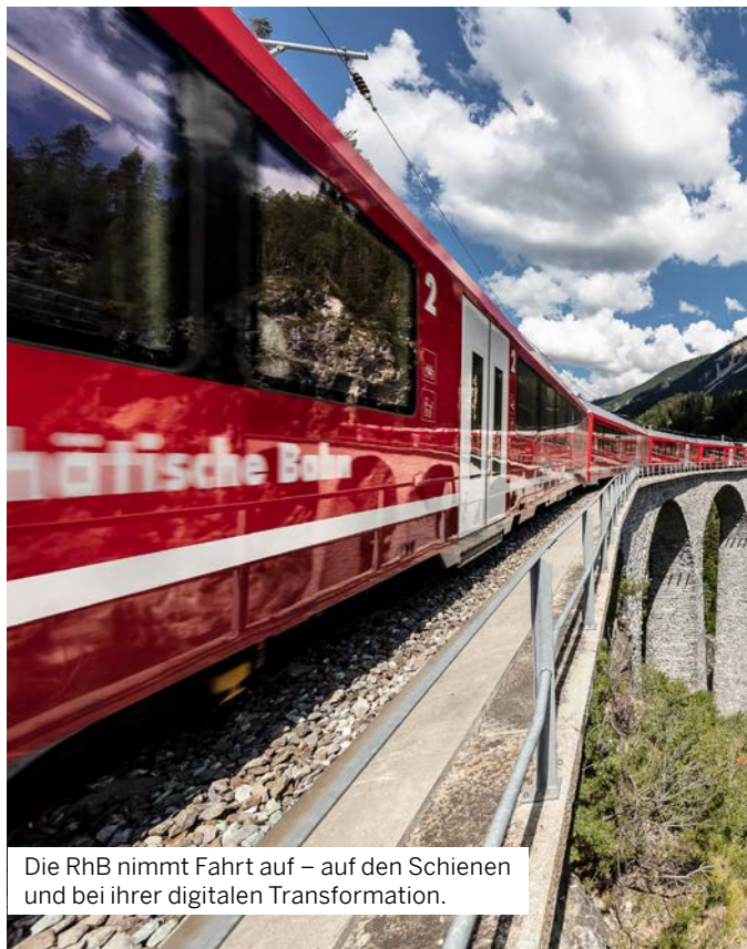
Die RhB nimmt Fahrt auf – auf den Schienen und bei ihrer digitalen Transformation.

Bei der Rhätischen Bahn ist Aufräumen und Modernisierung angesagt. Viele einzelne branchenspezifische ERP-Komponenten sollen bis ins Jahr 2023 einer standardisierten ERP-Systemlandschaft weichen.